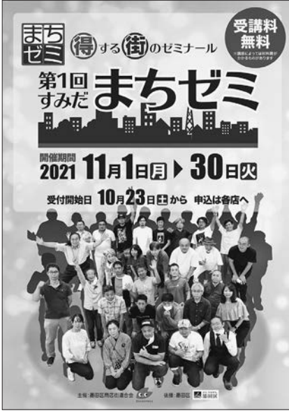
全66講座の内容、開催日時、店舗などの紹介 (紙面の都合で一部を掲載)

「第1回すみだまちゼミ」開催ポスター 墨田区商連では11月に、まちゼミとは、新規顧客獲得や区民等にお店の存在を身近に知ってもらうことを目的に、「第1回すみだまちゼミ」を開催しました。