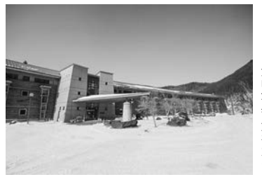
日光中禅寺金谷ホテル外観(上)と館内(暖炉)

イベントは前回と同様に、参加店で五百円以上の買い物をして頂いたお客様に、五百円につき一枚の豪華景品などが当たる応募ハガキを渡し、抽選会に参加してもらう。